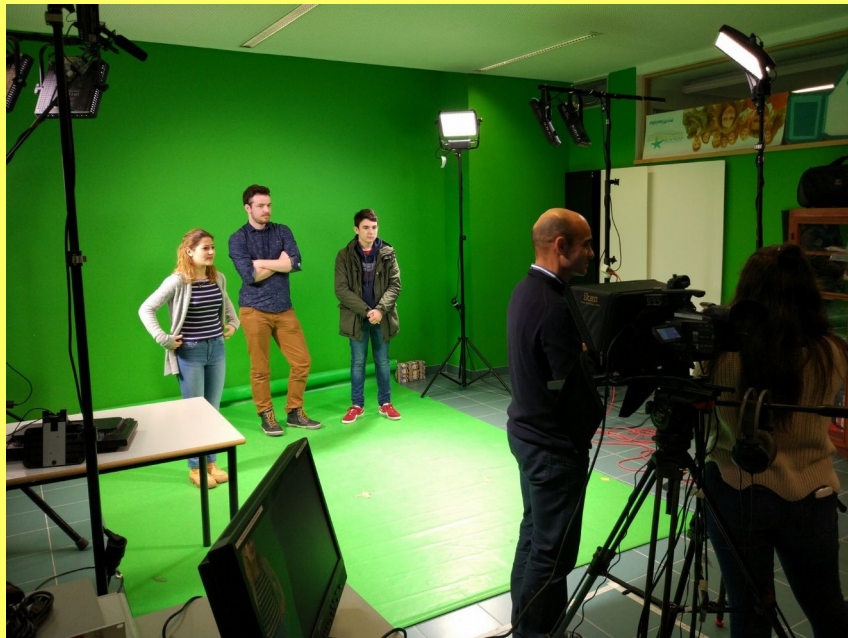
ESTUDIO DE GRABACIÓN