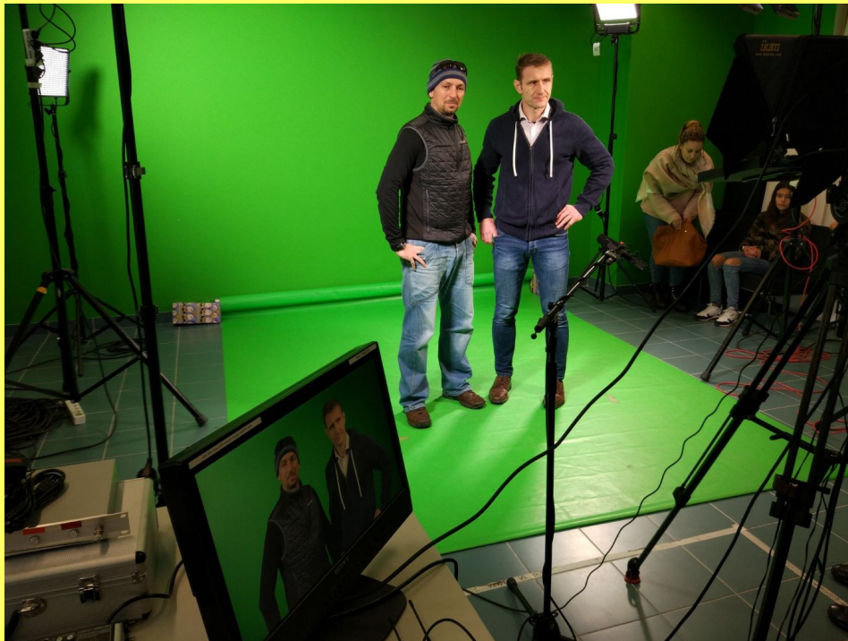
GRABACIÓN DEL VIDEO